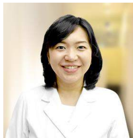
レイクリニック院長

このように、マスク内では色んな変化が生じているため、これまでマスクを付ける習慣がなかった方にはとてもつらい肌の変化ではないでしょうか。